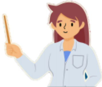
DOSEN/ TENAGA PENDIDIK