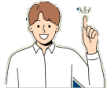
WARGA KAMPUS (OB, SATPAM, DLL)